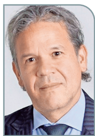
Por: Mauricio Velandia Profesor de la Universidad Externado de Colombia